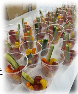
世田谷野菜を使った バーニャカウダ